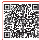
Inquadra il QR Code

Eventuali iscrizioni il giorno della manifestazione, con una maggiorazione di 2 €